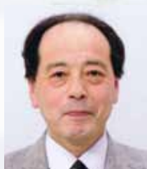
北海道医療大学 唯野貢司 教授