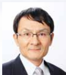
北海道大学 秋田弘俊 教授